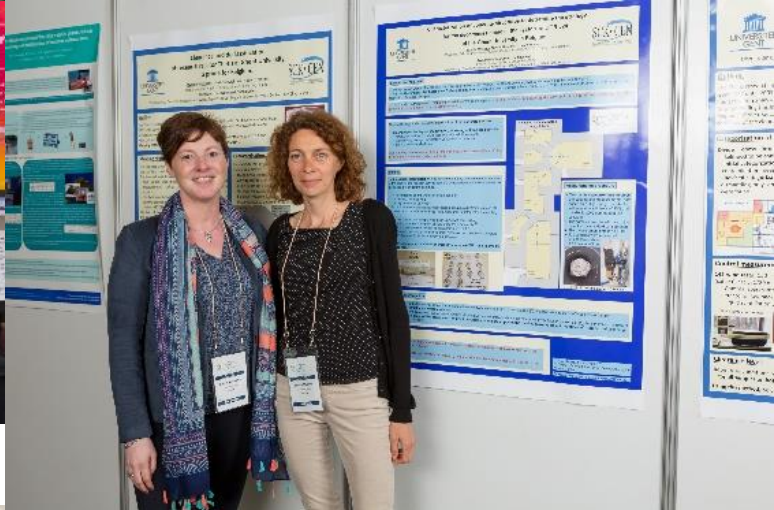
Acción en el Sala de Exhibiciones